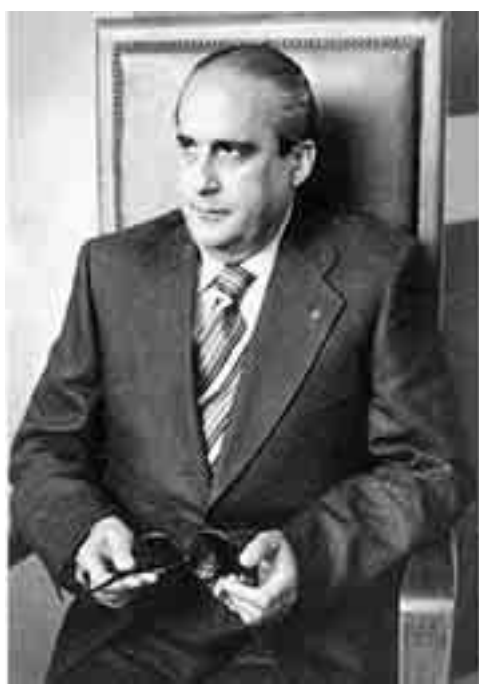
IL PROCURATORE GAETANO COSTA