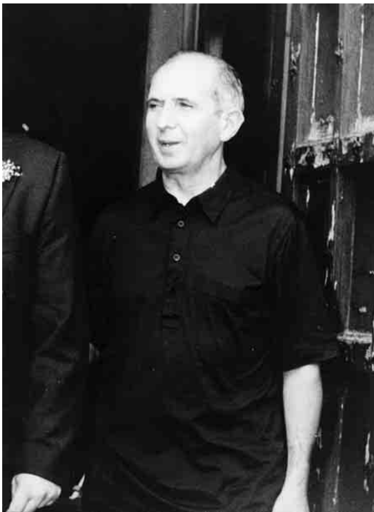
Nella foto centrale un primo piano del parroco di Brancaccio, don Pino Puglisi, assassinato dalla mafia la sera del 15 settembre 1993. Nella altre foto, in alto da sinistra: Padre Puglisi all'inizio del suo sacerdozio; una scena del film "Alla luce del sole", dedicato a "3P"; una significativa frase scritta dai bambini di don Puglisi. Il commando dei "picciotti" del quartiere era composto da Gaspare Spatuzza, Salvatore Grigoli, Nino Mangano, Cosimo Lo Nigro e Luigi Giacalone. Il religioso fu ucciso sotto casa