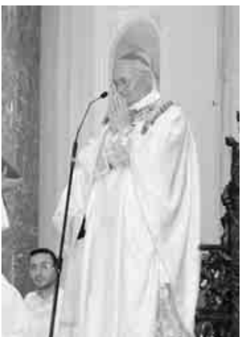
IL CARDINALE SALVATORE DE GIORGI

MESSA IN CATTEDRALE. Il ricordo del parroco della chiesa di San Gaetano affidato al cardinale Salvatore De Giorgi