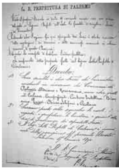
LO SCIoglimento DEI FASCI DEL CORLEONESE

comuni, non era verso queste ultime che bisognava colpire, bensì verso gli oppositori delle stesse. Così molte misure furono adottate seguendo i consigli e le designazioni dei gruppi dominanti», sottolinea ancora la Scolaro. L'8 gennaio, infine, furono istituiti tre tribunali militari (a Palermo, a Messina e a Caltanissetta), davanti ai quali, da febbraio in poi, si svolsero i processi contro i presunti responsabili dei tumulti e delle stragi. Bisogna dire, innanzi tutto che le accuse mosse agli imputati si basavano sulle dichiarazioni dei sindaci, delle guardie campestri e dei carabinieri. «Per rendersi conto della loro attendibilità e della loro "fedele" ricostruzione dei fatti, basta considerare che un sordomuto fu imputato per aver emesso "grida sediziose" durante i tumulti di Misilmeri...», conclude, amara, la Scolaro.