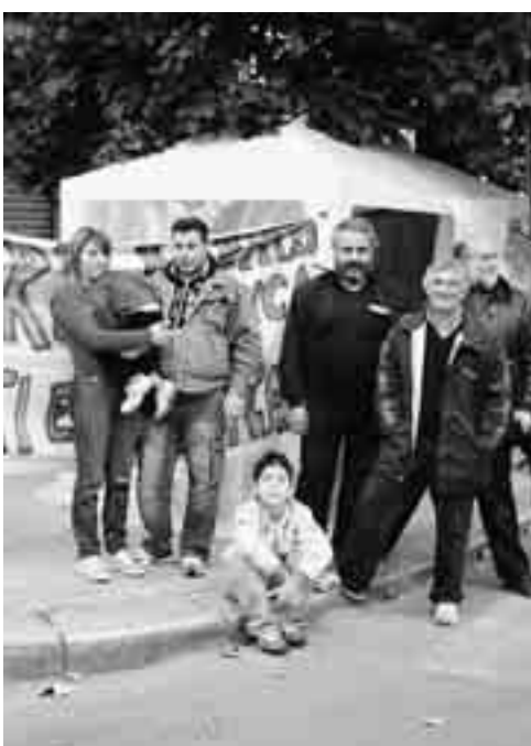
PROTESTA DEI SENZA CASA A PALERMO