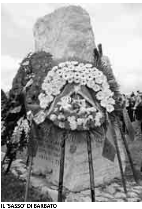
IL 'SASSO' DI BARBATO