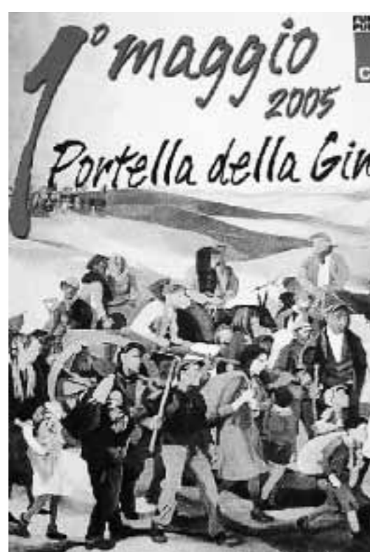
IL MANIFESTO 2005 DELLA CGIL CHE RICORDA LA STRAGE